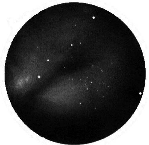
M 8 de Lagunenevel door een 6 cm sterrenkijker (door Wes Stone)