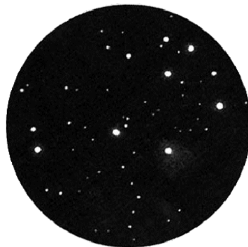
M 45 het Zevensterme door een 12 cm sterrenkijker (door K. Ikebe)

Dat de Aarde rond de zon beweegt heeft nog een tweede gevolg: dat het 's zomers later donker wordt dan 's winters. Hierdoor kun je 's winters al om een uurtje of 7 's avonds gaan sterren kijken, terwijl je midden in de zomer tot half 12 moet wachten. En zelfs dan is het eigenlijk nog niet helemaal donker en wordt het dat ook niet. We noemen dit de grijze nachten. Maar gelukkig wordt het in de zomer toch donker genoeg om de sterrenhemel te kunnen bekijken.